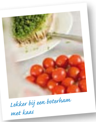
Lekker bij een boterham met kaas