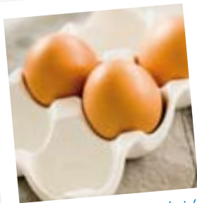
Neem mee voor bij de picknick

BMI = \text{kg}/\text{m}^2 . Een BMI tussen de 20-25 betekent een goed gewicht.